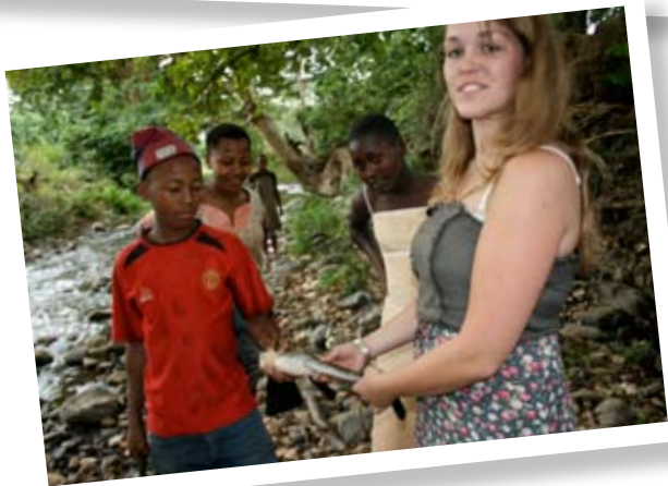
Een stukje educatie....., nu nog buiten....