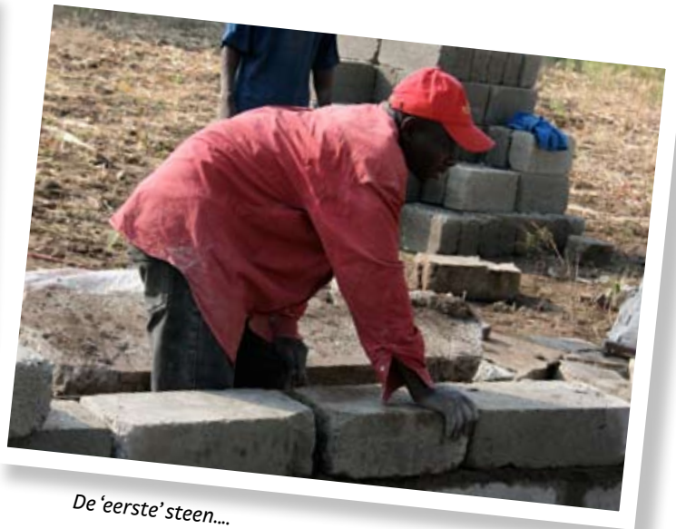
De 'eerste' steen...