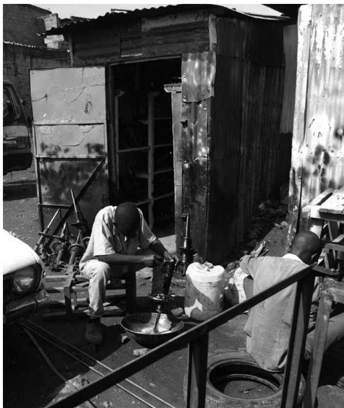
Autowerkplaats van Pandipieri Centrum

In het Pandipieri Centre hebben kinderen de mogelijkheid om naar school te gaan. Voor de jonge kinderen ligt de nadruk op het aanleren van schoolse vaardigheden (rekenen en taal), sociale vorming en indien nodig gedragsverbetering. Voor de oudere kinderen ligt de nadruk op het voorbereiden op deelname aan de arbeidsmarkt (als werknemer of als zelfstandig ondernemer) en het volledig kunnen onderhouden van zichzelf en later eventueel een gezin.