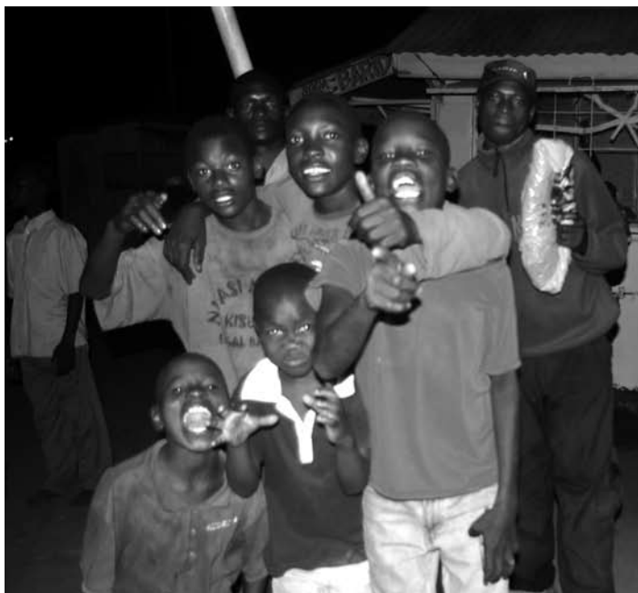
Kisumu-streetkinderen 's avonds laat op straat

Het project dat Run for Rio heeft gekozen voor haar lustrumjaar heeft haar zetel - al bijna 30 jaar - in Kisumu. De start van het Kisumu Pandipieri - project kon destijds vooruitstrevend genoemd worden: niet alleen ontwikkelingswerk waarbij hulp geven (voedsel, kleding, etc.) voorop stond, maar vooral het creëren van een aanbod van activiteiten gericht op het aanleren van vaardigheden waardoor de lokale gemeenschap zichzelf kan ontwikkelen. Hierbij werd rekening gehouden met de mogelijkheden en de risico's van het wonen in en nabij Kisumu en van de verantwoordelijkheden die jongeren daarin hebben. Inmiddels is het project gegroeid tot een organisatie met meerdere activiteiten voor kwetsbare kinderen (zowel jongens als meisjes) in de leeftijd van 3 - 18 jaar. De kracht van het project is - nog steeds - dat alle activiteiten zich richten op deelname aan de maatschappij of het creëren van een vooruitzicht daarop. Naast opvang en het geven van taal- en rekenonderwijs, hebben de verschillende activiteiten tot doel jongeren een vak te leren waar de gemeenschap baat bij heeft.