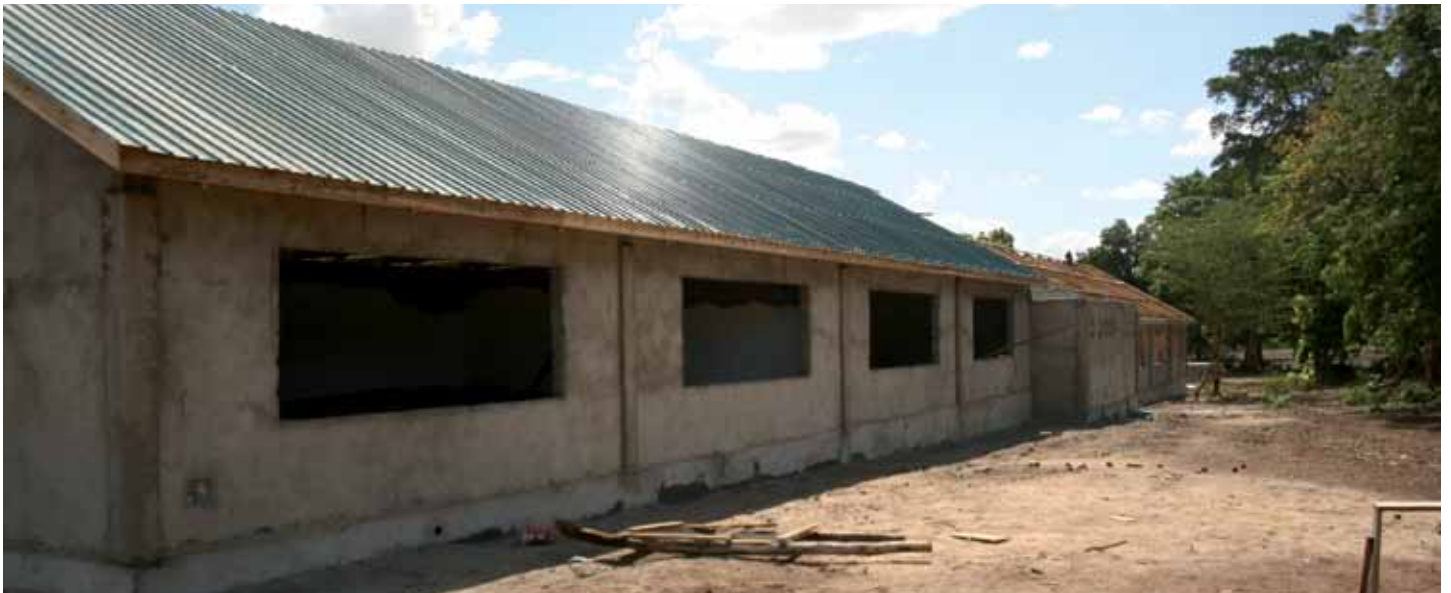
Het 2e schoolgebouw in aanbouw