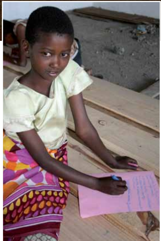
Nog even wachten op de schoolbanken