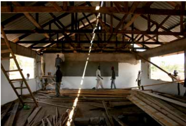
Buiten klaar...binnen verder