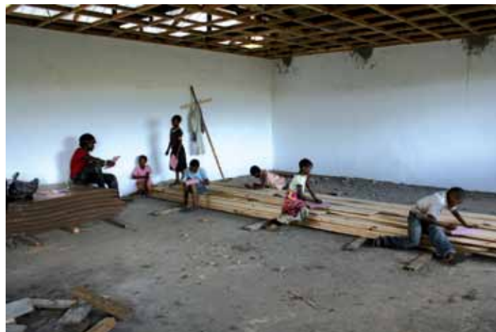
De kinderen kunnen nauwelijks wachten tot alles klaar is

Op de foto's ziet u een impressie van het totale project