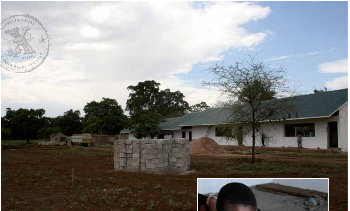
Het eerste schoolgebouw staat